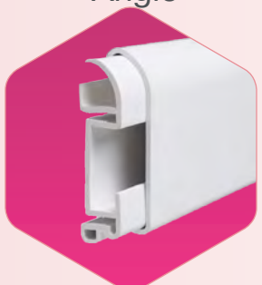
MPLC5 Plinthe cimaise